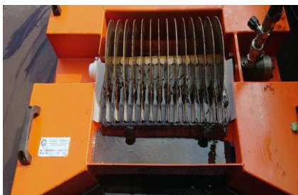
Skimmer συνδυασμού δίσκου και βούρτσας