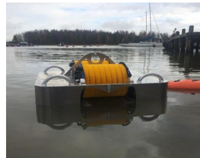
Skimmer με βούρτσα